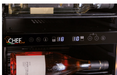
Termostato elettronico Electronic thermostat