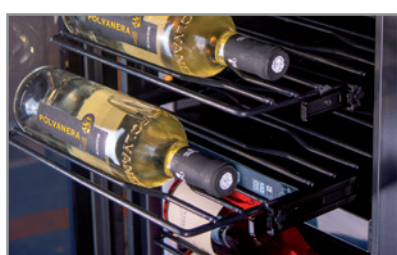
Mensole in metallo ad estrazione Metallic shelves with sliding system