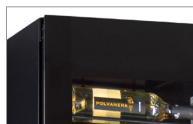
Porta a sfioro senza cornice Full glass frameless door