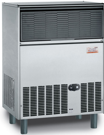
B 9040 AS/WS

La rinnovata gamma di produttori di ghiaccio in cubetti BAR-LINE produce cubetti di forma tronco-conica ad alta efficienza: definiti, limpidi, igienici e robusti per conferire ad ogni bevanda un naturale senso di freschezza.